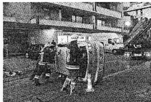
nuti. L'autista se l'è cavata con una lieve ferita alla testa e alcune contusioni. Oltre, naturalmente, a una buona dose di spavento. (sim)

MERANO. Carambola automobilistica acrobatica ma per fortuna senza conseguenze ieri intorno alle 17.30 in via Roma all'altezza del distributore Esso, non lontano da ponte della Posta. Un furgone intento a svoltare in via Mirabella è entrato in contatto con una Seat che, finendo su un muretto a bordo carreggiata, ha preso il volo capottando e terminando la piroetta, non prima di incocciare su un lampione, adagiandosi sul fianco del passeggero. Tanto sconquasso (e danneggiamenti anche ad un'auto posteggiata lungo la via) all'arrivo delle forze dell'ordine e della Corce rossa, ma effetti relativamente conte-