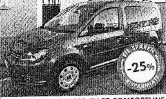
VW CADDY 1.6 TDI 102 CV 5P COMFORTLINE 09/2010, taffee brown met., 41.000 km, € 21.900