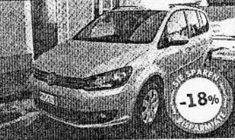
VW TOURAN 1.4 150 CV COMF. ECOFUEL 12/2011, argento met., 100 km, € 22.900