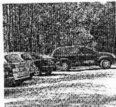
I due parcheggi a Monticolo hanno fruttato alle casse del Comune di Appiano oltre 90 mila euro

LE ENTRATE. Nel 2009 gli introiti del Comune dai vari parcheggi comunali ammontavano a 43.294 euro. Un primo incremento c'è stato nel 2010 con 60.584,14 euro di incassi. Ma la vera crescita, come detto, c'è stata quest'anno con un introito di 156 mila e 201 euro, di cui 90.309 eu-