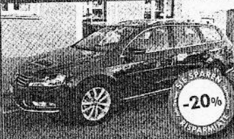
VW PASSAT VAR. 2.0 TDI 140 CV DSG BM 10/2011, nero prof. perla, 200 km, € 30.900