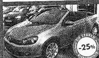
VW GOLF CABRIOLET 1.6 TDI 105 CV 08/2011, tungsten silver met., 100 km, € 22.900