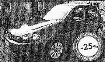
VW GOLF 1.2 TSI 5P COMF. BLUEM. TECH. 02/2011, blu met., 100 km, € 16.900