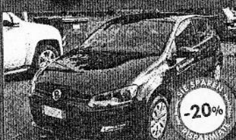
VW POLO 1.4 85 CV 5P COMFORTLINE 07/2011, nero prof. perla, 2.000 km, € 12.900