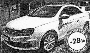
VW EOS 1.4 TSI 122 CV BLUEMOTION TECH. 07/2011, bianco candy, 4.700 km, € 23.900