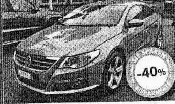
VW PASSAT CC 2.0 TDI 140CV DPF 10/2009, grigio met., 43.500 km, € 21.900

Offerta valida solo per le vetture raffigurata