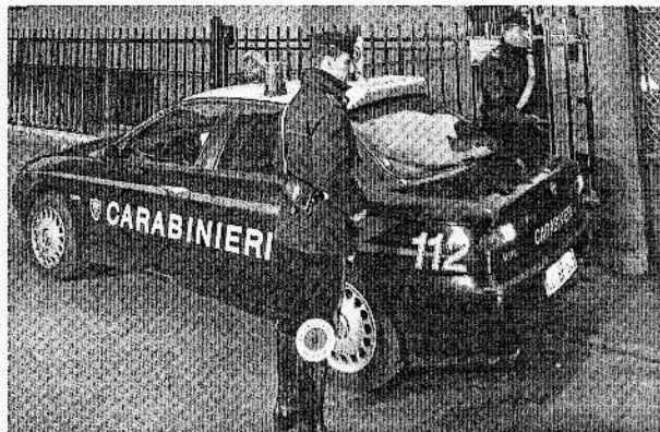
Qui sopra, una pattuglia di carabinieri; a fianco Piazza Teatro