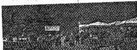
BRU scorsi sporti ma et pattinazione. Le rlie fe 2006

Grande partecipazione alla manifestazione