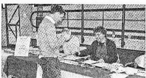
Le Poste hanno previsto un annullo speciale

APPIANO. È piaciuto molto l'annullo speciale che le poste hanno realizzato per la seconda edizione di EppanPhil, la mostramercato di francobolli che si è tenuta domenica presso il palazzetto dello Sport di Appiano. Numerosi gli appassionati non solo altoatesini che si sono recati a vedere i francobolli della bella esposizione allestita nella palestra. Ma ancor più numerosi quelli accorsi a cercare rarità e pezzi mancanti tra i tavolini di piccoli e grandi appassionati. Tra questi anche vari professionisti in cerca del pezzo più pregiato. La manifestazione organizzata dall'associazione dei giovani filatelici dell'Alto Adige promette di diventare presto uno degli appuntamenti più gettonati per gli amanti di rarità e memorabilia in campo filatelico e i tanti appassionati che vi hanno partecipato si sono già dati appuntamento al prossimo anno, con immutato entusiasmo. (an.ca.)