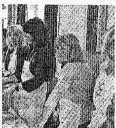
Le volontarie

CALDARO. Tanti e generosi. I caldarensi sono accorsi in grande numero domenica alla settima edizione della «Suppensohtag», la domenica della minestra a scopo benefico organizzata dall'associazione delle Famiglie e delle Donne cattoliche e dal gruppo Valadares che sostiene alcuni progetti di cooperazione in Brasile. Oltre un migliaio di piatti di zuppa calda serviti dalle volontarie in cambio di un'offerta. Alla fine il ricavato è stato di circa 3 mila euro. Affollatissima, infatti, la sala grande delle associazioni. Con tavoli apparecchiati anche sul palco delle rappresentazioni. Per l'occasione i volontari hanno cucinato 13 tipi di minestra, trasformando quello che è stato sempre un rito del dopo messa dei paesi altoatesini in un'occasione di beneficenza. Oltre alle minestre le associazioni hanno portato anche torte e bevande offerte da alcune cantine del paese. Buona parte del paese è stato quindi coinvolto in questa